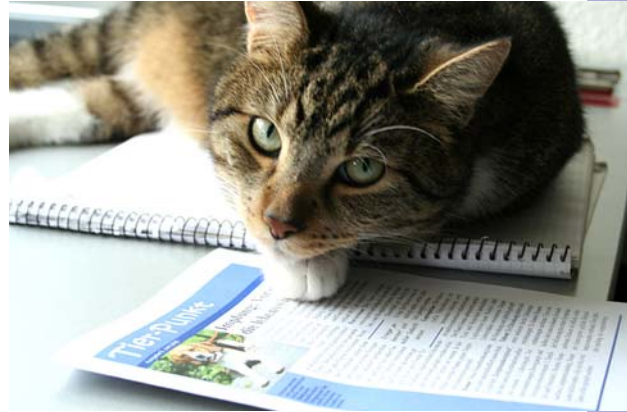
Kater Elvis ist noch häuslicher geworden.

Da ich bei einem größeren Ausflug von unserem unliebsamen Nachbarskater „vermöbelt“ worden bin und mich der Tierarzt erst einmal krank schreiben musste, war ich in meinem geliebten Garten einige Zeit nicht einsatzfähig.