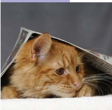
Abgebildete Rasse: Deutsch Langhaar

Weibliche Tiere, die stets „rollig“, also empfängnisbereit werden, stehen regelmäßig unter Hormonstress, wenn der Deckungsakt ausbleibt. Für Kater bedeutet die Kastration ein deutlich geringeres Risiko im Freigang. Denn: Unkastriert läuft er kilometerweit, um eine rollige Katze zu finden. Dabei besteht die Gefahr, dass er überfahren wird.